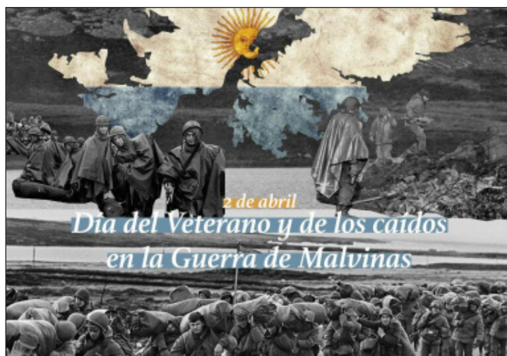
Reino Unido durante el conflicto de 74 días.

El 2 de abril se conmemora en Argentina el Día del Veterano y de los Caídos en la Guerra de Malvinas, recordando el desembarco de tropas argentinas en las islas en 1982. Esta fecha rinde homenaje a los 649 soldados fallecidos y a todos los veteranos que lucharon por la soberanía nacional contra el