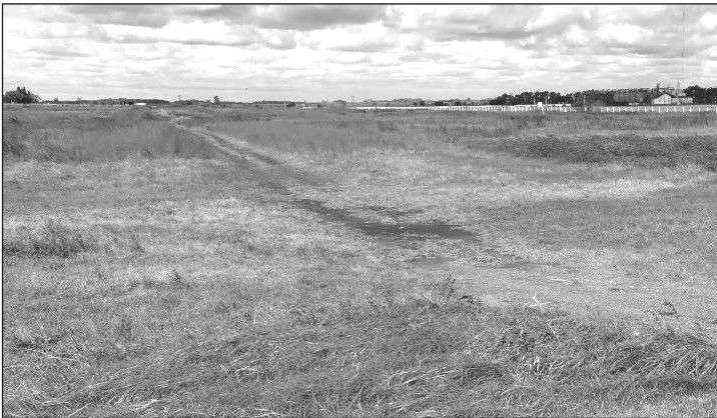
Otro año que el Parque Industrial de Rojas no avanza.

En medio de un contexto sumamente complejo, con los gremios en la calle, con gran parte de la población redoblando las energías para llegar a fin de mes, con los jubilados y la discapacidad alzando la voz en forma permanente, con empresas que multiplican los esfuerzos para sostenerse, y con una clase política que cada vez se aleja más de la realidad, se cierra este 2025, con un panorama de mucha incertidumbre, donde la fe y la esperanza son motores determinantes para salir a la calle cada día.