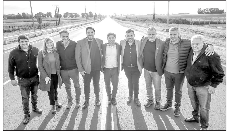
Axel Kicillof inauguró las obras de la renovada Ruta Provincial 31.