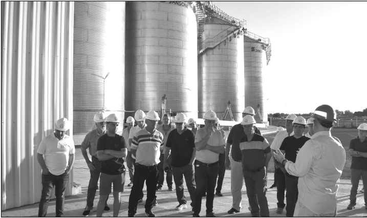
La Cooperativa de Carabelas inauguró una nueva planta en Rojas.

Año XXI - N° 7.235 - Rojas Bs. As. - Miércoles 31 de Diciembre de 2025 Edición Anuario de 24 Páginas - Precio ejemplar: $ 2.500,00