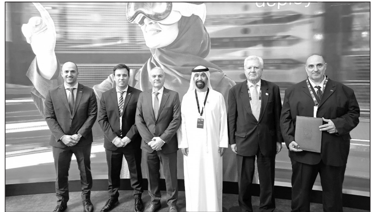
En 2025, AFA firmó un memorandun con la empresa arabe ADNOC