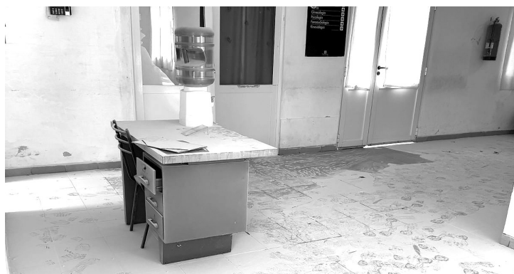
ESTACION DE POLICIA COMUNAL DE SEGURIDAD ROJAS

En la primeras horas de la mañana prestó declaración el masculino que fue autor de los graves daños que se produjeron en el Centro Integrador Comunitario en la jornada del domingo. Está imputado también por el robo en una vivienda y ahora quedó a disposición de la justicia.