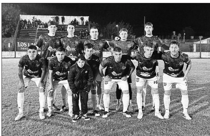
Compacha General de Salto.