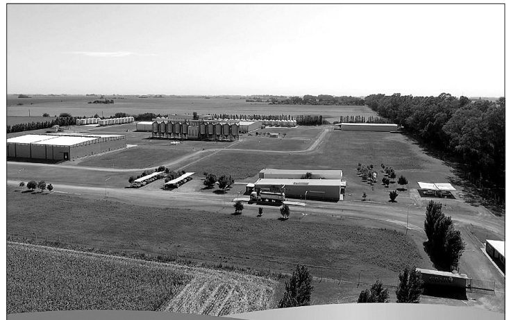
PARQUE DE AGROSERVICIOS (PAS), ROJAS.

"Acá se puede ver lo que es la educación, lo que sucede y queremos que siga sucediendo dentro de las aulas y en cada escuela, porque hay un trabajo muy grande detrás de cada proyecto", concluyó.