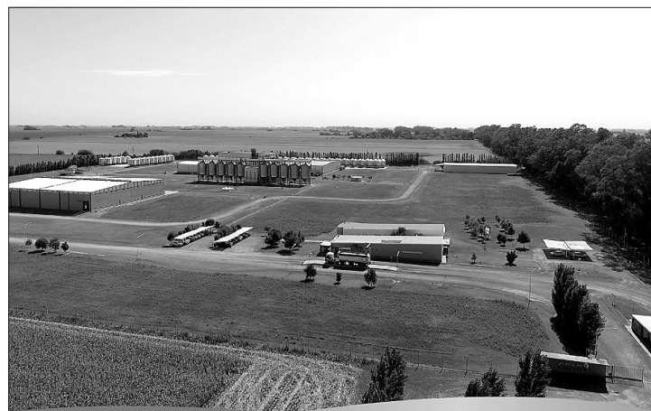
PARQUE DE AGROSERVICIOS (PAS), ROJAS.

“Lo presentamos durante la feria del libro, lo leímos y ahora estamos organizando varias cosas para caminarlo, porque nos pasa que cada libro avanza y la forma de mostrarlo es distinta, con “Sola en el Bosque” fueron los conversatorios, con “Palabras semilla” en las escuelas y ahora estamos navegando de que manera seguirá saliendo al mundo “Acá estoy”, siempre pensando en hacerlo de una manera que sea creativa”, finalizó.