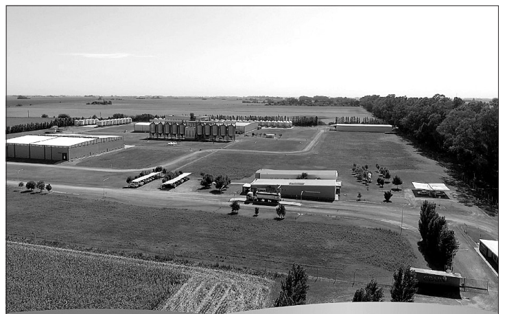
PARQUE DE AGROSERVICIOS (PAS), ROJAS.

Por último, apuntó que “una vez que ellos respondan, que no sabemos que van a decir, el juez tendrá el petitorio del municipio y la respuesta de la parte demandada, y con eso determinará la medida, que ojalá sea la que pedimos desde la municipalidad, que es la restitución inmediata”.