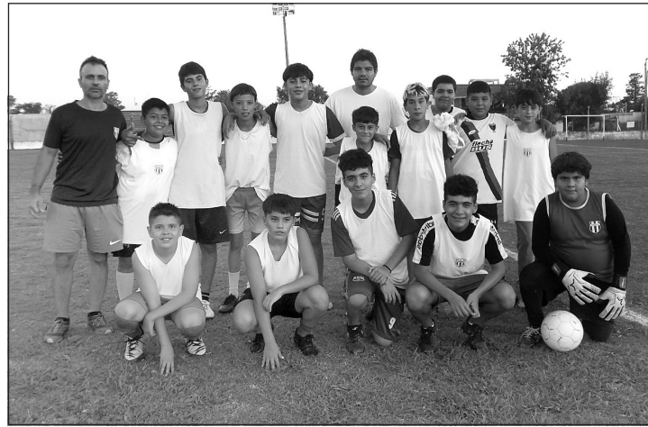
Los pibes de Juventud jugaron varios amistosos de cara al inicio del certamen, que se postergó una semana.

En la jornada de hoy comenzaría el certamen Apertura de Divisiones Juveniles, pero por las condiciones climáticas y el estadio de los campos de juego la Liga decidió postergar el arranque.