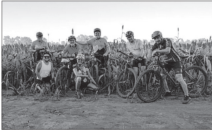
El Municipio y Los Rústicos organizan un cicloturismo histórico para el sábado que viene.

La actividad organizada de manera conjunta por el Municipio a través de la Dirección de Deportes y el grupo Los Rústicos se llevará a cabo el 23 de marzo a la tarde, partiendo desde la explanada de la UNNOBA.