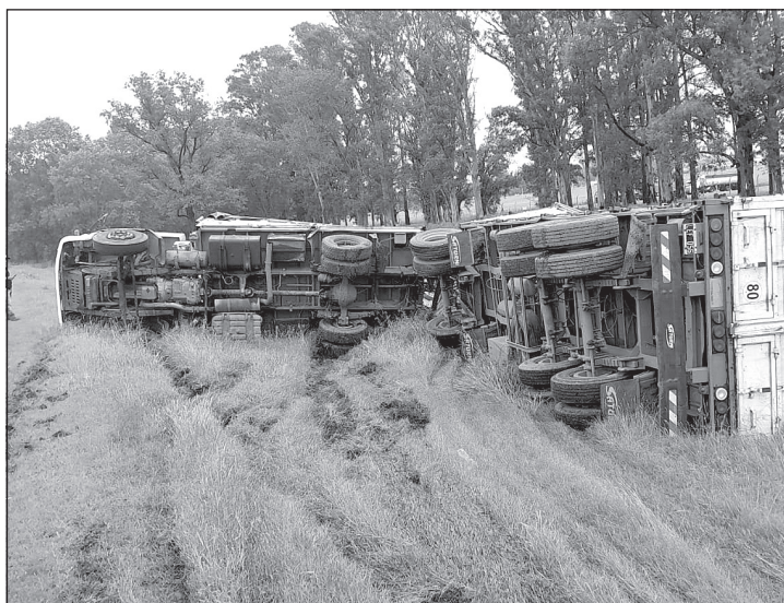
Un camión volcó en la mañana de ayer en la 188 tras esquivar el cruce de un auto.

El accidente se produjo en dirección Pergamino-Rojas a la altura de lo que corresponde al predio de la Cooperativa de Carabelas. El conductor tuvo que hacer una maniobra por cruce de un vehículo y terminó en la banquina.