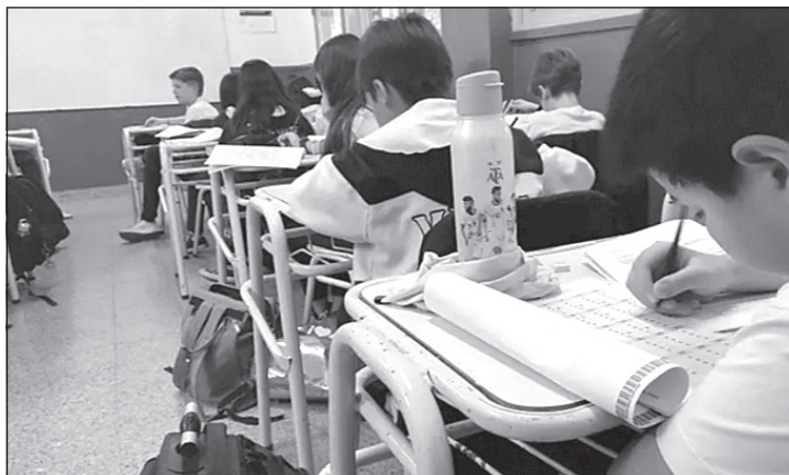
En la Legislatura Bonaerense evalúan prohibir el uso de telefonía celular.

A través de un proyecto presentado en la Legislatura buscan regular el uso del celular en la escuela primaria. El impacto en los chicos.