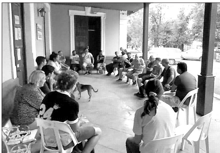
En el Centro Cultural de Rafael Obligado se realizó la charla informativa sobre el curso de electricista.

El Centro de Formación Laboral "Ministro Dr. René Pérez" finalizó con el período de inscripción para los diferentes cursos que brindará a lo largo de este nuevo ciclo, algunos de los cuales ya se pusieron en marcha, como por ejemplo el de Acompañante Terapéutico